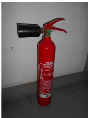
3. kép: Hordozható tűzoltó készülék