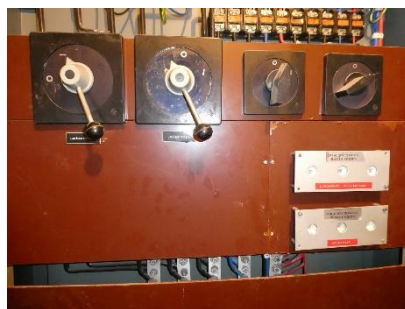
5. kép: A lépcsőházankénti tűzeseti főkapcsolók