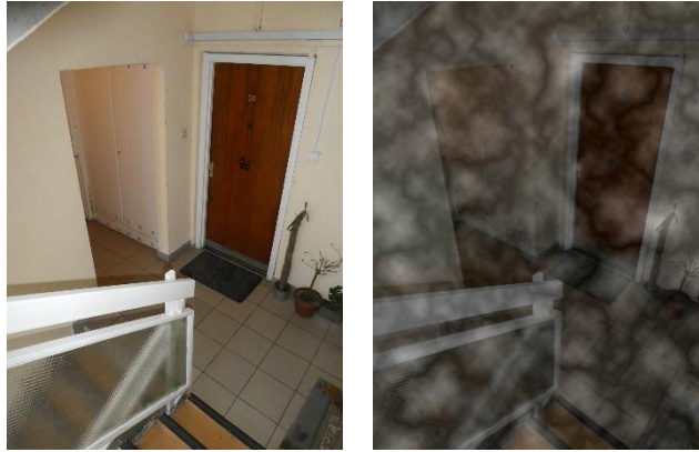
1. kép: Menekülési útvonal, a keletkező füst látást korlátozó hatása