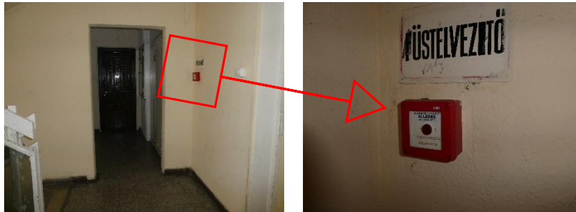
2. kép: Hő- és füstelvezetést biztosító távnyitó